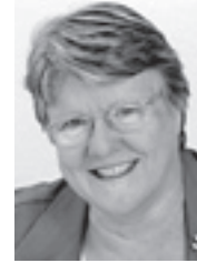
Dr. iur. Judith Stamm alt Nationalrätin Luzern