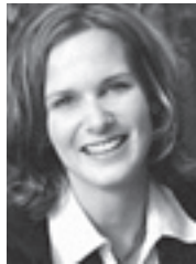
lic. iur. Evi Allemann Nationalrätin Bern