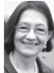
Dr. med. Yvonne Gilli Fachärztin für Allgemeinmedi- zin FMH, Klassische Homöopathie, Traditionelle chinesische Medizin Nationalrätin Wil SG