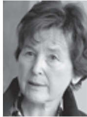
Dr. iur. Elisabeth Kopp alt Bundesrätin Zumikon